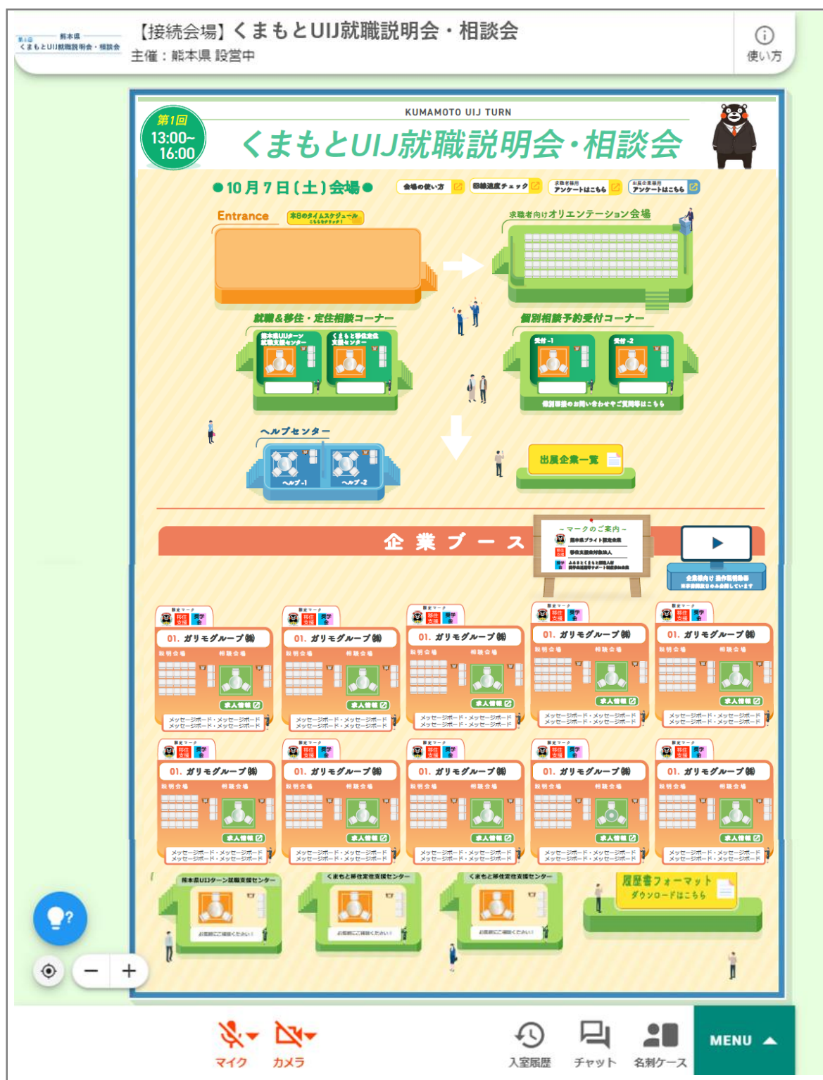
オンラインイベント会場「GALIMO」※イベント会場例（実際のデザインとは異なります）