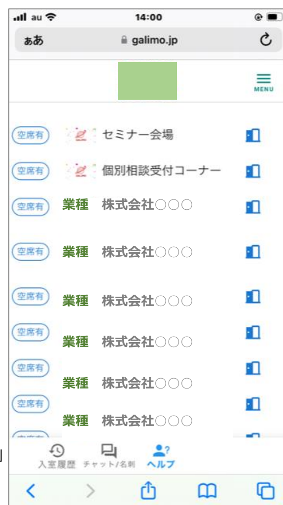
オンラインイベント会場「GALIMO」スマートフォン操作画面 ※実際のデザインとは異なります

オンライン上のイベント会場「GALIMO」を使い、対面の合同説明会さながらに企業説明会への参加や個別相談が可能です。PCやスマートフォン、タブレットでも参加いただけます。