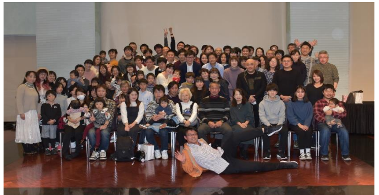
家族も一緒にクリスマス会！